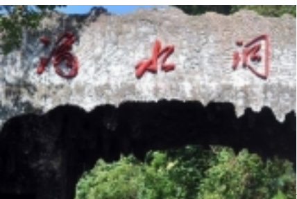
探访毛泽东66年隐居滴水洞