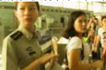
长沙边检站的明星秘事