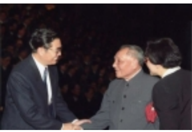
胡锦涛20年工作图片精选