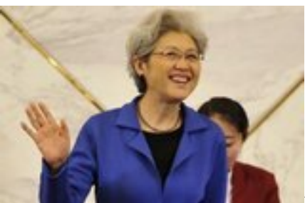
领导人身边传奇女翻译们