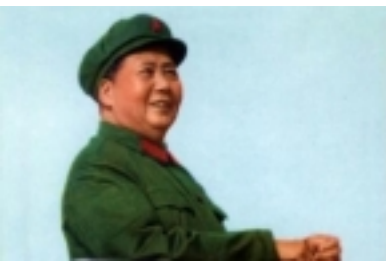
中共历届领导人军装组图