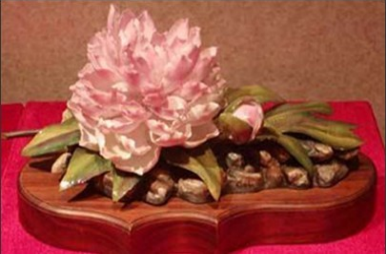
盘点邓小平的奇珍异宝