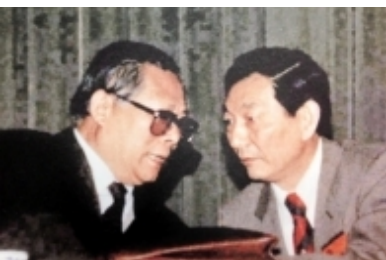
朱镕基上海老照片大汇集