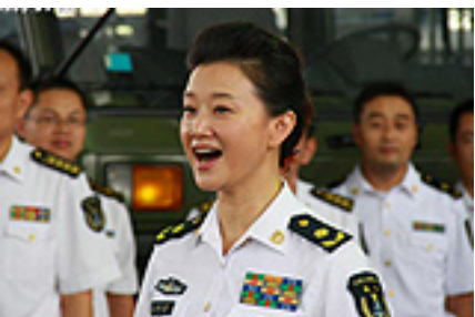
宋祖英升职后首次率团亮相