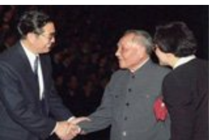
胡锦涛20年工作图片精选