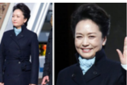
盘点彭丽媛出访造型