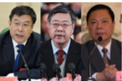
中央巡视组组长什么来头?