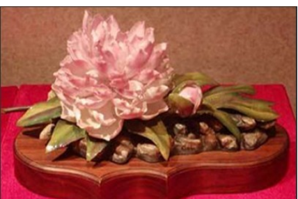
盘点邓小平的奇珍异宝