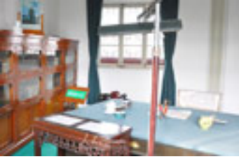
组图：周恩来办公室