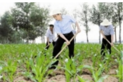
书记省长干起农活也是好把式