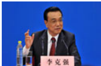
开书店怎让李克强忧心