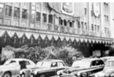
毛泽东时代特权商店